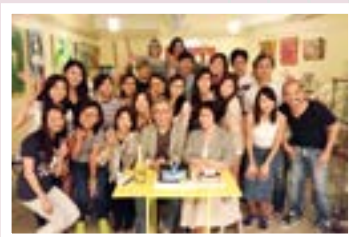
◆ 心晴行動慈善基金活動留影

於是曾太林建明便聯同各界專業人士，成立「心晴行動慈善基金」於2004年，致力加強大眾對情緒病的認識，減少誤解和歧視及對症治療的方法，成效顯著，令不少人受惠，更得到廣泛支持，至今已服務十多年，助人無數。